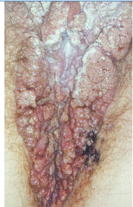
Abb. 4 ▲ Condylomata acuminata

Die Patientinnen beklagen chronischen Pruritus, brennende Schmerzen oder auch ein „Gefühl des Wundseins“. Dies sind Symptome, die auch bei den differentialdiagnostisch in Betracht kommenden benignen Veränderungen des äußeren Genitale der Frau häufig beschrieben werden. Bei der Inspektion und Vulvoskopie ist auf Veränderungen des Oberflächenreliefs der Vulva aber auch auf Pigmentveränderungen zu achten (■ Abb. 5 ). Insbesondere Leukoplakien und ulzerierende Veränderungen sind als suspekt einzustufen und sollten biopsiert werden. Es kommt nicht selten vor, dass Patientinnen bereits eine lange Zeit lang erfolglos mit verschiedenen Lokalthapeutika behan-