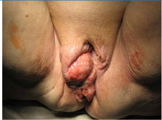
Abb. 6 ▲ Ausgedehntes Vulvakarzinom

achten. Die Symptome der Patientinnen sind unspezifisch, ein Pruritus tritt häufig schon bei präinvasiven Veränderungen auf (s. oben), in fortgeschrittenem Stadium kommt es zu Ulzerationen, Blutungen oder kondylomatösen Veränderungen (▣ Abb. 6).