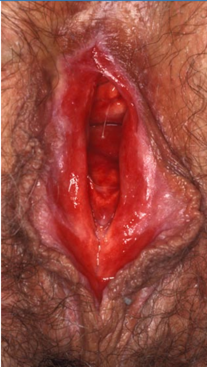
Abb. 3 ▲ Lichen ruber

nische Erkrankung. Durch die Therapie kann häufig eine gute Linderung der Beschwerden erreicht werden, nicht jedoch eine Heilung [9].